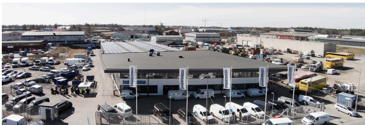
Lundagrossistens hämtlager i Länna

Utöver avfallshantering erbjuder vi även våra kunder utbildningar i certifiering enligt köldmedieförordningen, i syfte att undvika utsläpp av fluorerade växthusgaser och på så sätt minska växthuseffekten. Vi erbjuder dem också att returnera värmepumpar och andra kylmaskiner innehållande dessa gaser, för evakuering och deponering.