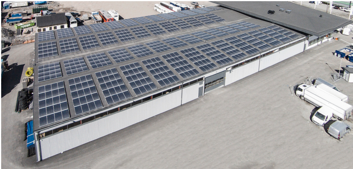
Lundagrossistens hämtlager i Länna