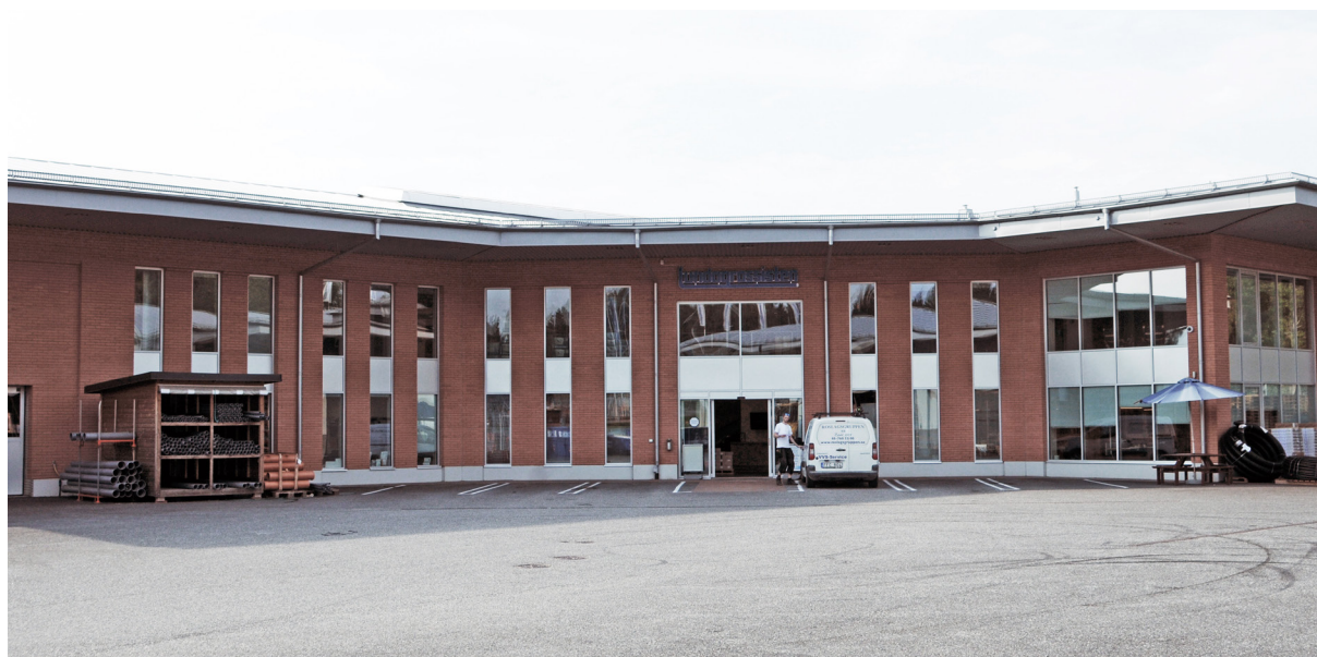
Lundagrossistens hämtlager i Täby

Tack vare en fläkt i ena änden av byggnaden och stora luffintag i andra änden, ventileras och kyls Lundagrossistens lager nattetid. Den ackumulerade kylan från hundratals ton metalldelar bidrar sedan till att hålla nere rumstemperaturen under dagens varmare timmar. Genom bygg- och installationstekniska åtgärder åstadkoms således en mer miljövänligt kylmetod. Elen som krävs för fläktens nattdrift är marginell i förhållande till den kyleffekt som tillskapas.